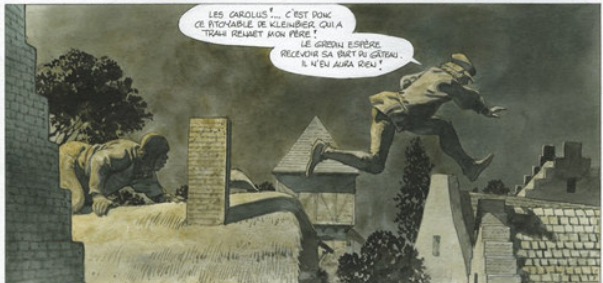
Un certain air de Tyl l'Espiègle...